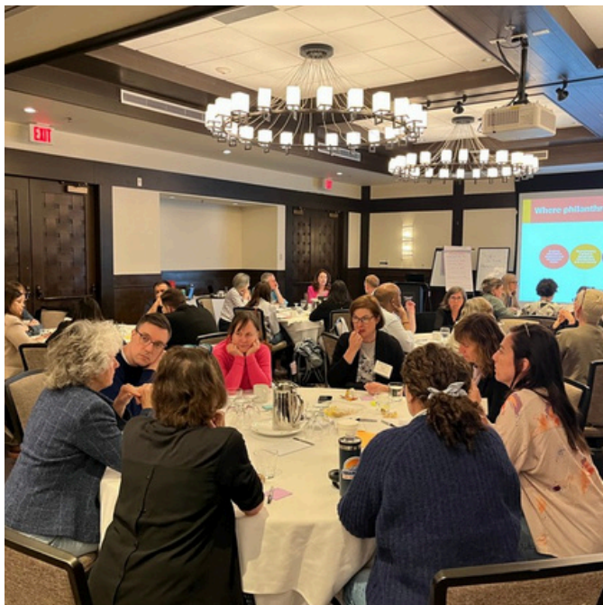
Table ronde sur le logement

En réponse à l'aggravation de la crise du logement, FPC a réuni ses membres pour qu'ils s'échangent des stratégies visant à renforcer l'écosystème du logement, qu'il s'agisse de fonds mis en commun, de plaidoyer en matière de politiques, d'infrastructures partagées ou de solutions techniques. Un nouveau Groupe d'affinité des bailleurs de fonds pour le logement , lancé au début de 2026, est né de cette table ronde.