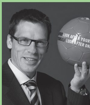
Johann Koss Président Right To Play Toronto