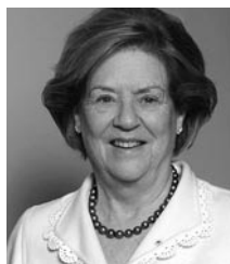
HON. MARGARET MCCAIN, O.C.

Présidente du conseil d'administration de la Margaret and Wallace McCain Family Foundation et lieutenant-gouverneure du Nouveau-Brunswick de 1994 à 1997.