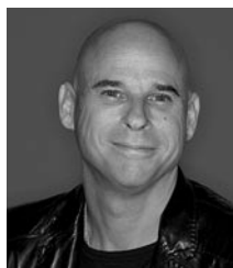
GUY LALIBERTÉ, O.C.

Administrateur délégué de la Fondation du Roi Baudouin de Bruxelles et auteur du livre intitulé Foundations—Creating Impact in a Globalised World .